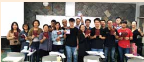
▲台灣基督長老教會台灣神學院