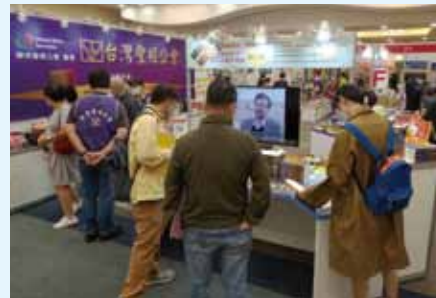
▲2020/10/29-11/3 基督徒書展—台北(信基大樓)