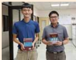
▲真耶穌教會台灣總會神學院