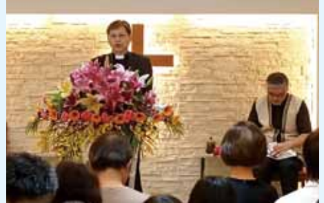
▲2020/10/4 異象傳遞—基隆七美長老教會