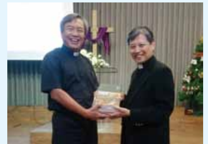
▲2020/11/8 異象傳遞—高雄信望愛基督教會