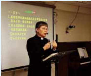
▲2020/10/7 異象傳遞—台北改革宗神學院