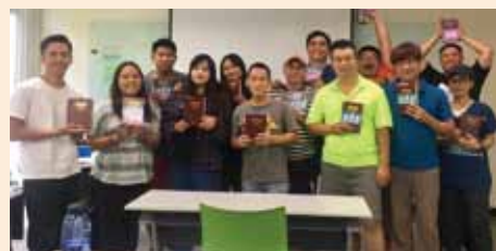
▲台灣基督長老教會玉山神學院