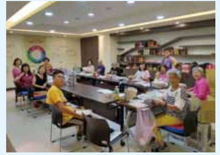
▲2020/9/7 志工團協助寄季刊—台灣聖經公會