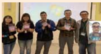
▲靈糧教牧宣教神學院