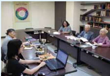
▲2020/10/23 客語聖經會議—台灣聖經公會