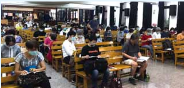
▲2020/11/7 詮釋講座(彼得後書/猶大書)—高雄新興長老教會