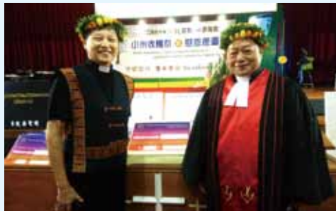
▲2020/10/11 屏東魯凱宣教70週年慶—屏東大仁科技大學