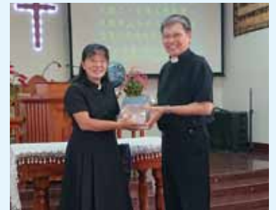
▲2020/11/1 異象傳遞—彰化草港長老教會