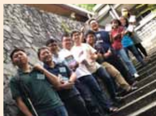
▲台灣浸信會神學院