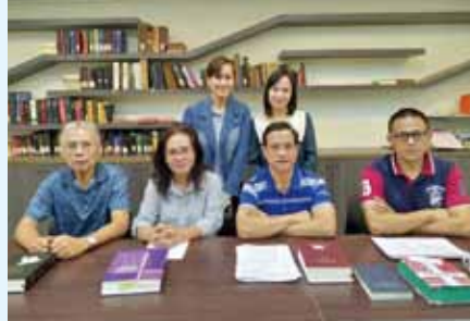
▲2020/9/30 泰雅語聖經排版會議—台灣聖經公會