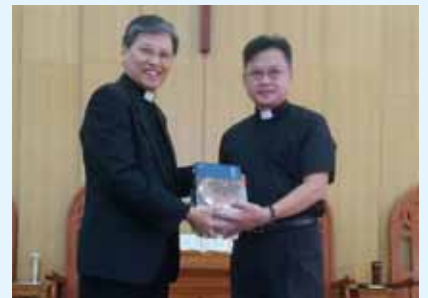
▲2020/10/18 異象傳遞—台中沙鹿長老教會