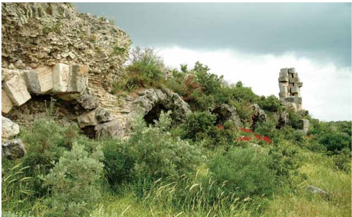
特羅亞主後二世紀浴場的遺跡

保羅在第三次宣教旅程離開以弗所之後，應是沿愛琴海岸向北來到特羅亞，期望與提多在該處見面，但並未在那裏見到提多，在此情況下保羅離開特羅亞，西行前往馬其頓（林後2:12-13，對照徒20:1），有可能是希望在馬其頓某處可以遇見提多（對照林後7:5-7）。