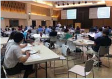
▲2020/8/31 詮釋講座(約翰福音：成為神的兒女) —台北和平長老教會+直播