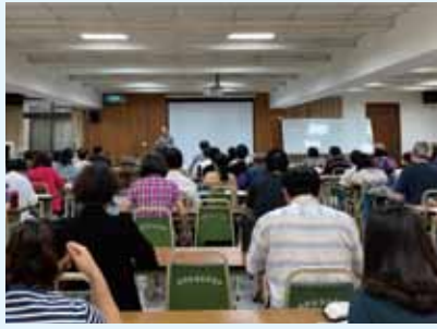
▲2020/9/5 詮釋講座(路得記)—高雄新興長老教會