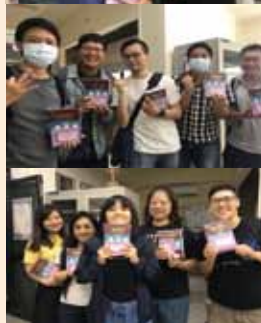
▲台灣基督長老教會台南神學院