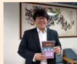
▲基督門徒訓練神學院