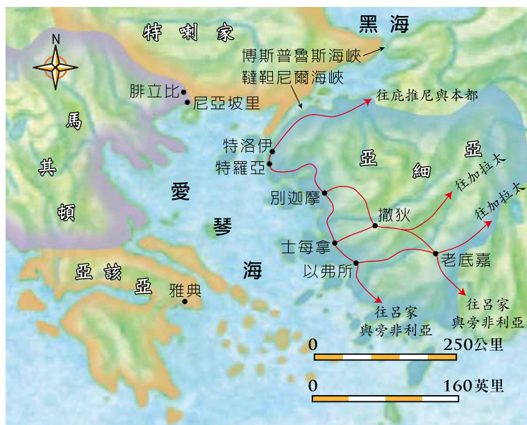
特羅亞、特洛伊與愛琴海周遭地理位置

按羅馬的傳說，特洛伊陷落之前，城中的勇士埃涅亞斯（Aeneas，與徒9:33「以尼雅」希臘文同）受到諸神的指引，背負着父親，懷抱自己的兒子，帶領了一小群人逃離特洛伊，尋找新的安身之所。在地中海周圍不斷飄泊與多次遷徙之後，最終他們在拉丁烏（Latium；即今日羅馬所在的地區）落腳，成為羅馬人的始祖。因着上述的傳說，傳聞凱撒（Gaius Julius Caesar，主前100-44年）曾考慮將首都從羅馬遷往特洛伊或附近的特羅亞，但最終並未實行。之後，凱撒奧古斯都（主前約63年—主後14年）則將特羅亞設置為獨立的羅馬駐防城（殖民地），擁有與意大利本土城市相同的權利，當地人一出生便可擁有羅馬公民權。主後一世紀時，一般估