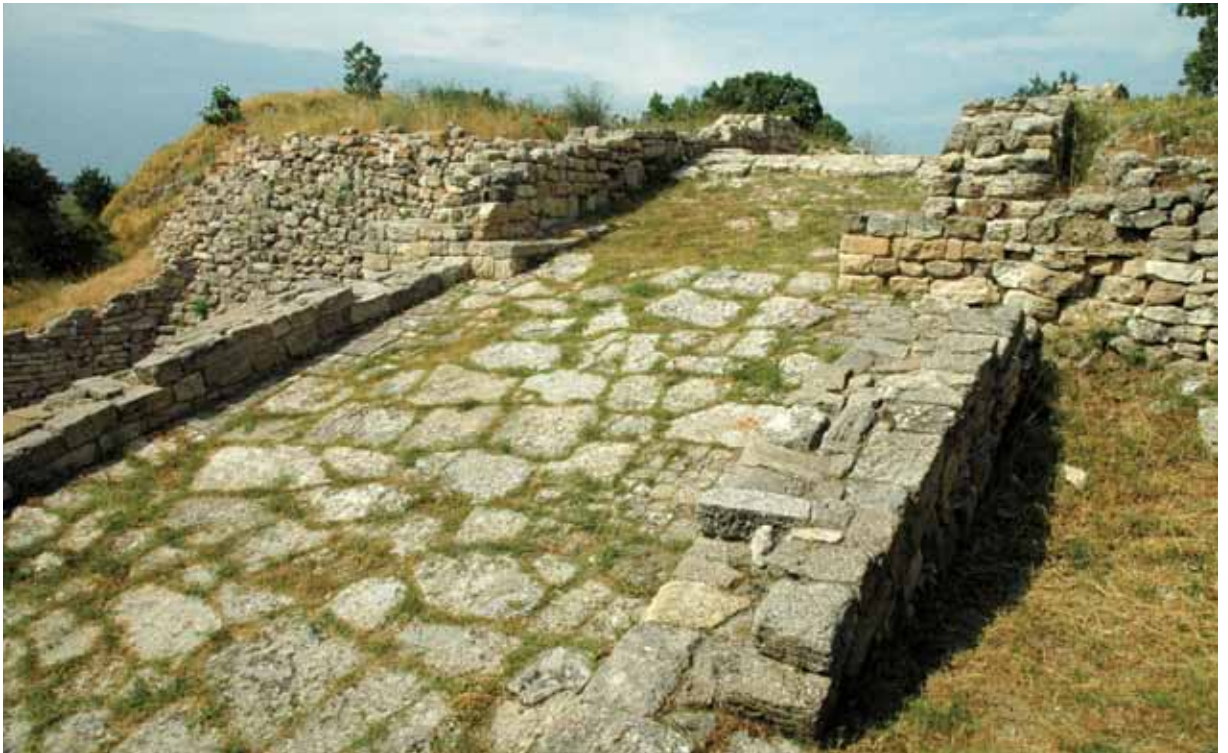
特洛伊遺址中進入內城宮殿的大道