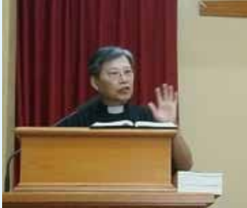
▲2020/9/13 異象傳遞—彰化中山長老教會