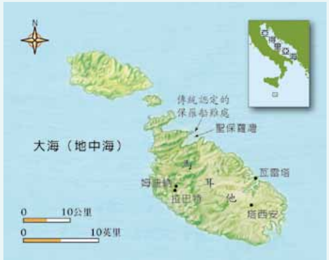
今日的馬耳他與其它相關地理位置。

主前八世紀左右，腓尼基人從東方而來，在此建立了殖民地，為其向西繼續前進的貿易中轉站，腓尼基人將該島命名為「馬耳他」，該名為閃語，意為「庇護所」，他們也在島內