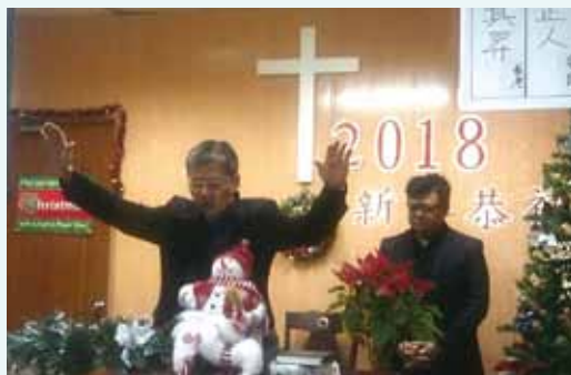
▲2018/01/07 異象傳遞—通霄長老教會