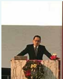
▲2017/12/17 異象傳遞— 衛理公會安素堂