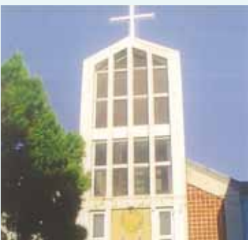
▲2017/12/31 異象傳遞—苗栗公館長老教會