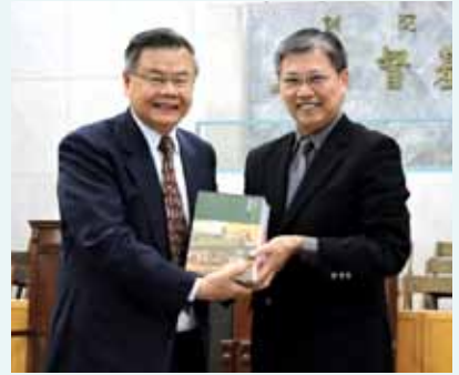
▲2017/11/24 異象傳遞—浸信會神學院