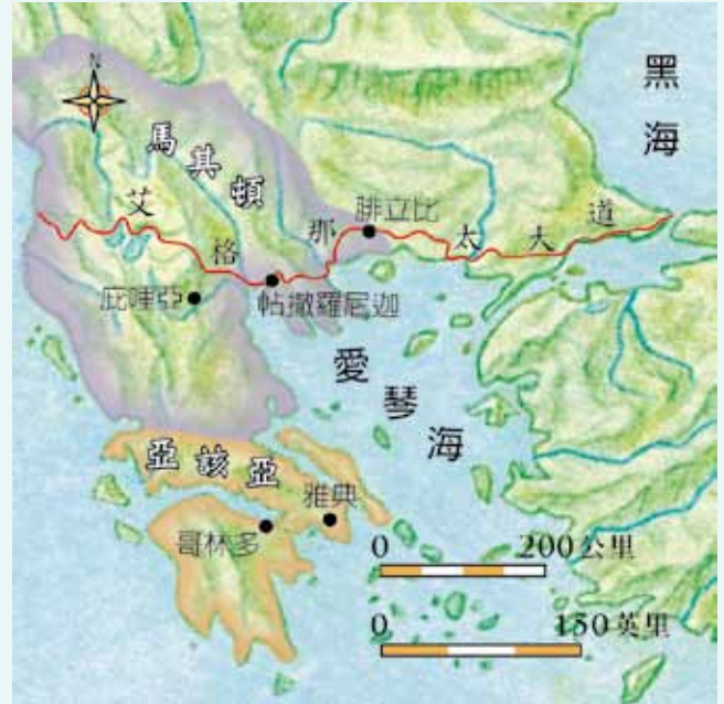
主後一世紀的帖撒羅尼迦與其它相關地理位置。

帖撒羅尼迦為卡參德（Cassander；主前約350-297年）於主前316/5年所建。卡參德原為亞歷山大大帝（Alexander the Great，主前356-323年）的部將，其妻子為亞歷山大大帝同父異母的姊妹。主前323年亞歷山大大帝駕崩後，卡參德的父親安提帕特（Antipater，主前約397-319年）成為帝國的攝政，卡參德受其派遣回馬其頓協助統治，他在馬其頓的這段期間，在帖撒利（Thessaly）建立了帖撒羅尼迦，以他妻子之名「帖撒羅妮迦」為該城命名。他妻子之名有特殊的來歷，當他妻子出生時，適逢她的父親腓力二世（Philip II，主前382-336年）戰勝帖撒利回來，因此將她命名為「帖撒羅妮迦」，意為「帖撒利的勝利」，故卡參德以帖撒羅尼迦命名該城，不僅代表了馬其頓統治的延續，也可能期許該城成為帖撒利一帶的光榮。該城所在區域，古代有一稱為特摩