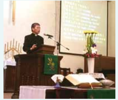
▲2018/01/28 異象傳遞—聖望長老教會