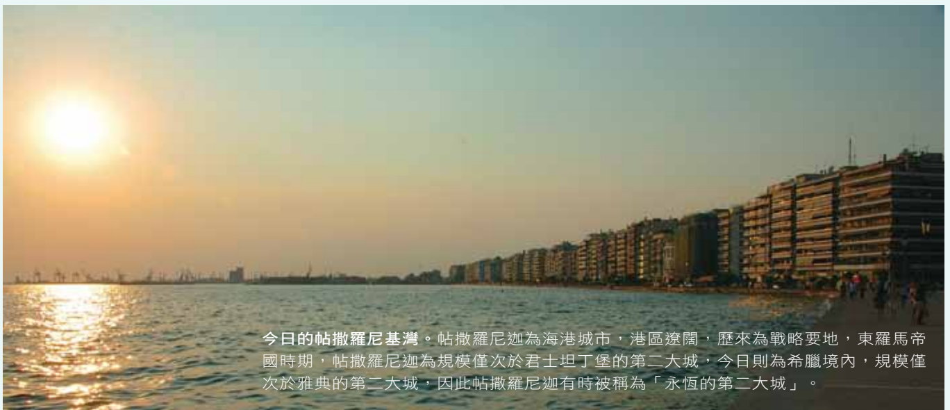
今日的帖撒羅尼基灣。帖撒羅尼迦為海港城市，港區遼闊，歷來為戰略要地，東羅馬帝國時期，帖撒羅尼迦為規模僅次於君士坦丁堡的第二大城，今日則為希臘境內，規模僅次於雅典的第二大城，因此帖撒羅尼迦有時被稱為「永恆的第二大城」。

主前168年，羅馬將馬其頓納入版圖，將其分為四區，以帖撒羅尼迦為第二區的首府。主前146年，羅馬設立馬其頓省，以帖撒羅尼迦為該省的首府，可享商業與民事的特權（包