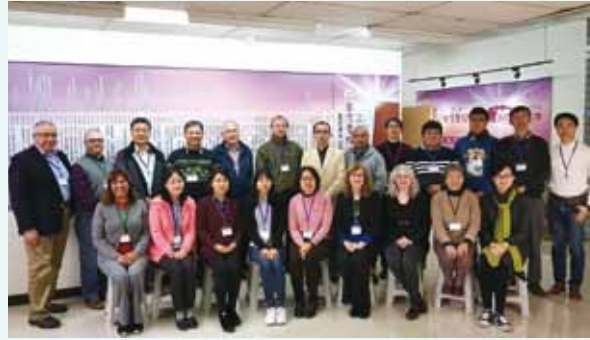
▲2018/02/04-09 聯合聖經公會DBL研習會