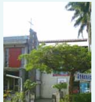
▲2017/12/24 異象傳遞—台中建德浸信會