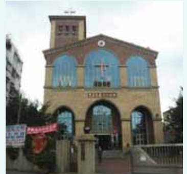
▲2018/02/11 異象傳遞—田中長老教會