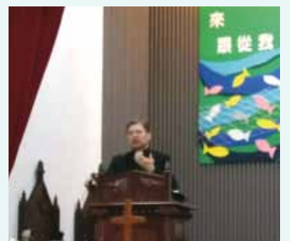
▲2018/01/21 異象傳遞—中壢長老教會