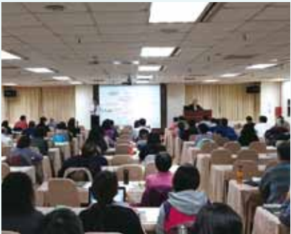
▲2017/12/11-13 聖經詮釋營—北捷北投會館