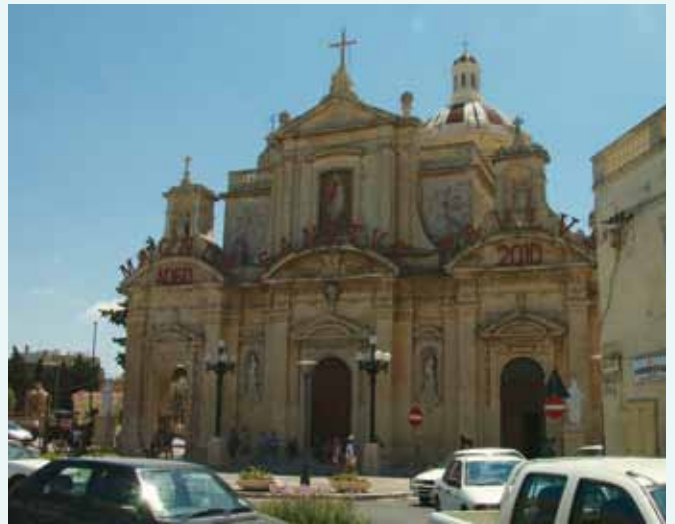
馬耳他聖保羅洞窟教堂。該教堂位於拉巴特，建於一地下洞窟之上，該洞窟相傳為保羅在此過冬居住之處。

主後59年底，保羅前往羅馬的旅程中(徒27:1-28:16)，因為遇到船難，一行人被迫在馬耳他停留了三個月，直到冬天結束(徒