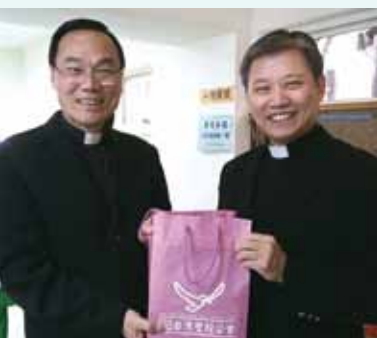
▲2018/01/14 異象傳遞—台北東門長老教會