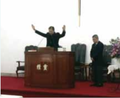
▲2017/11/19 異象傳遞—新生教團新生教會