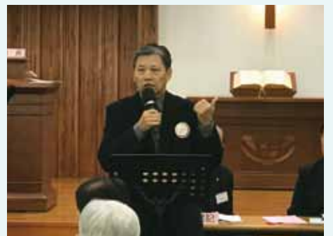
▲2018/01/09 長老會台北中會 第67屆第一次 議會—台北南門長老教會