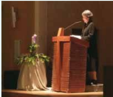
▲2017/12/03 異象傳遞—台北和平長老教會