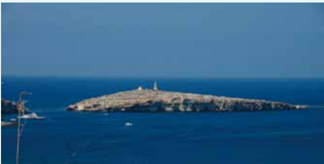
教會傳統認定保羅在馬耳他船難的地點。教會傳統認定，船難即發生在圖中間的島嶼邊緣，島上凸起的部分，即保羅船難紀念碑，圖左方的陸地即為馬耳他本島，隔狹窄的海峽與小島對望。

按當地傳統，保羅在島上三個月的時間，主要停留在姆迪納近郊的拉巴特(Rabat)，今日拉巴特的聖保羅教堂，相傳建於保羅在此停留時居住的洞窟之上。☒