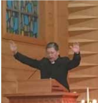
▲2017/12/17 異象傳遞—士林長老教會