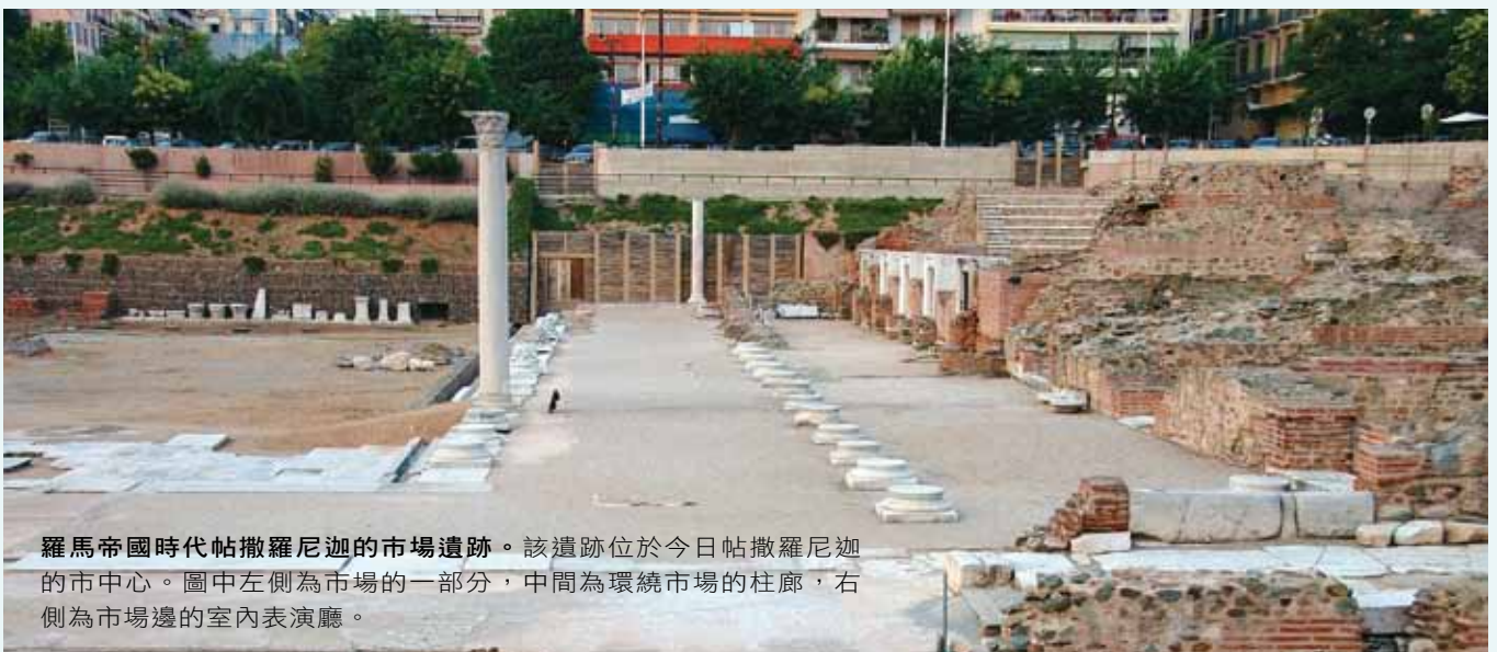
羅馬帝國時代帖撒羅尼迦的市場遺跡。該遺跡位於今日帖撒羅尼迦的市中心。圖中左側為市場的一部分，中間為環繞市場的柱廊，右側為市場邊的室內表演廳。

迦庇路的信眾相信，迦庇路會不時復生顯現，他復生的力量，可以保佑信眾行船安全，免於危難，帶來正義，迦庇路特別庇護製造鐵