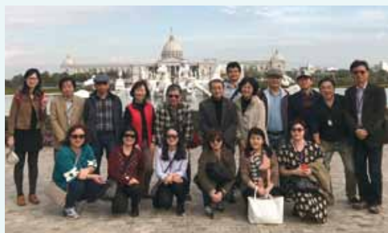
▲2018/01/15-18 日韓台三國筷子聯盟