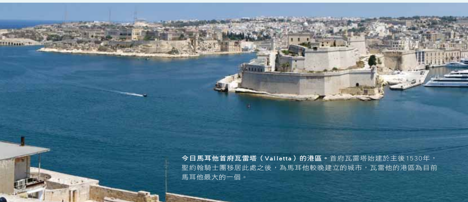
今日馬耳他首府瓦雷塔(Valletta)的港區。首府瓦雷塔始建於主後1530年，聖約翰騎士團移居此處之後，為馬耳他較晚建立的城市，瓦雷他的港區為目前馬耳他最大的一個。