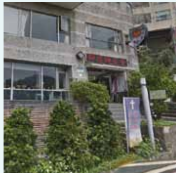
▲2018/01/28 異象傳遞—新店神召會