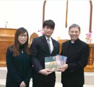
▲2018/02/04 異象傳遞—八里長老教會