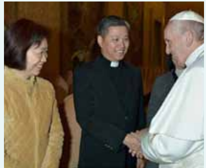
▲2017/12/07 拜訪教廷方濟各教宗—梵蒂岡