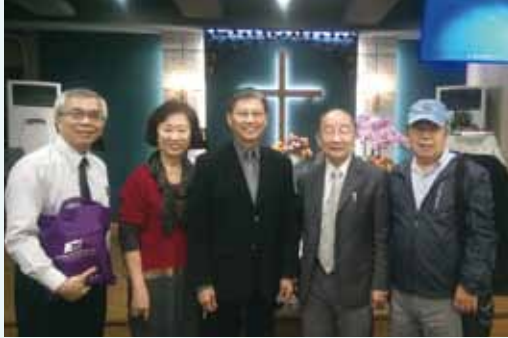
▲2017/11/22 異象傳遞—正道福音神學院