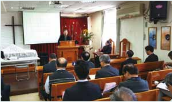
▲2018/01/24 長老會新竹中會 第78屆第二次議會—啟信長老教會