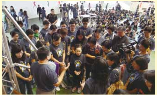
▲ 當天活動籌備前，全體同工為著「牛仔聖經青春大會串」串起雲嘉南各區的青少年來到上帝的面前的佈道事工同心禱告，透過聖靈親自動工運行在當中。