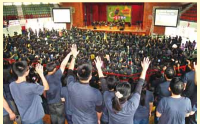
▲ 75間教會，約1500人齊聚在嘉義東區體育館，同心敬拜上帝，也學習透過上帝的話語來建造每個人的生