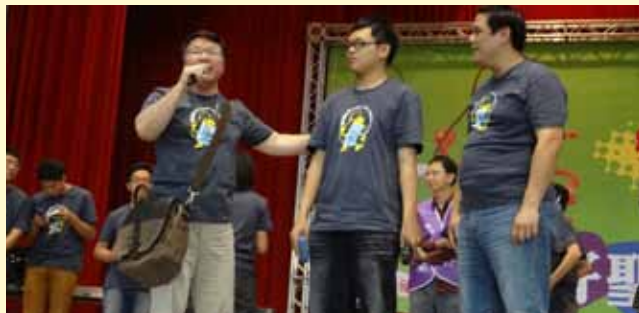
▲ 潘牧師精心設計的「聖經題目」，讓與會者認真的翻閱聖經，回答問題，然後開心的把獎項帶回教會，這是一段high到高點的時刻，上帝話語為大家帶來無限的喜樂。

籌備本次佈道會過程裡，除了行政上的預備與安排外，大會也呼籲強調：各教會要鼓勵「一領一」，即帶領自己朋友、同學、親人出席青春大會串的行動；牛仔聖經與T恤及有「獎」徵答的豐富獎品，確實也是一項吸引人